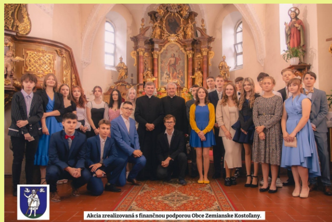
Akcia zrealizovaná s finančnou podporou Obce Zemianske Kostolany.

V lete sa organizujú výlety alebo turistika, kde je na mieste poďakovať rodičom, ktorí sú ochotní zabezpečiť cestu a náklady autom. V auguste sa konal v našom kostole organový koncert sprevádzaný spevom a poéziou. Účinkovali na ňom mladí študenti a absolventi