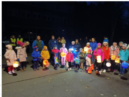
L. Čupcová

S Vianočnými sviatkami je spojená charita. Trvanlivé potraviny, hygienické potreby a suché pečivo sa dostali do útulku Dobrý pastier v Kláštore pod Znievom a Charita - dom sv. Vincenta v Prievidzi. Touto cestou chceme poďakovať všetkým, ktorí sa akokoľvek zapojili do týchto našich akcií. STALI STE SA AJ VY SVETLOM!