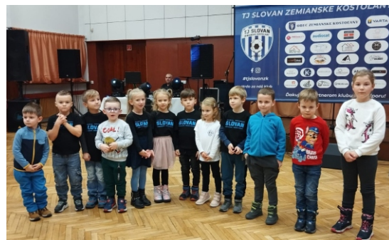
Predprípravka U6 na ukončení futbalového roka.

Prípravil: Marián Rybár