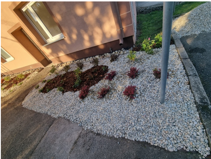
Výsadba nových trvaliek pred obecným úradom.