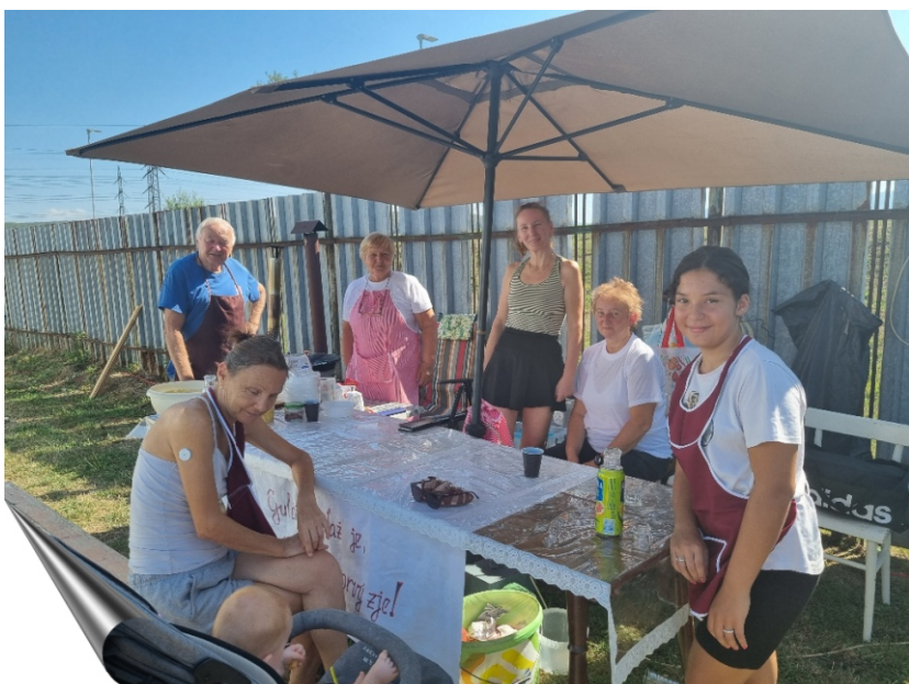
Družstvo Ďurtovci počas prípravy víťazného kotlíkového guláša.