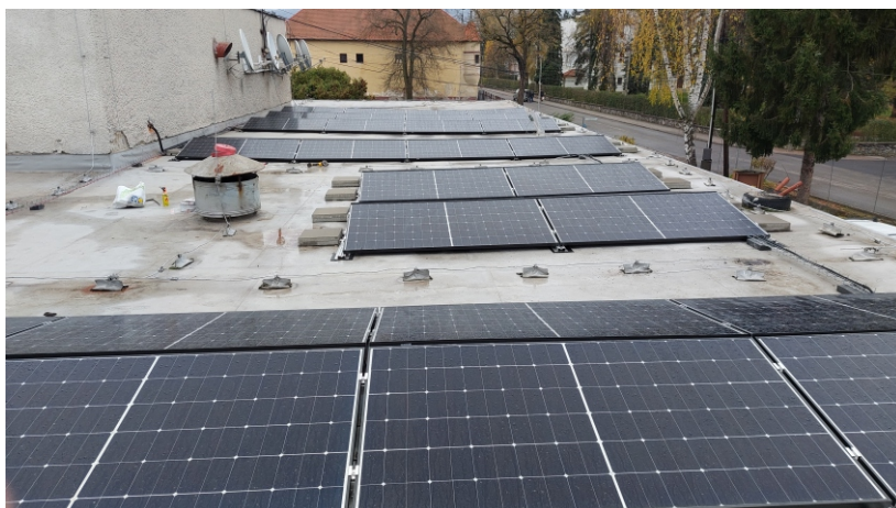
Panely fotovoltaickej elektrárne na budove domu kultúry.

Technické vlastnosti oboch stavieb sú totožné.