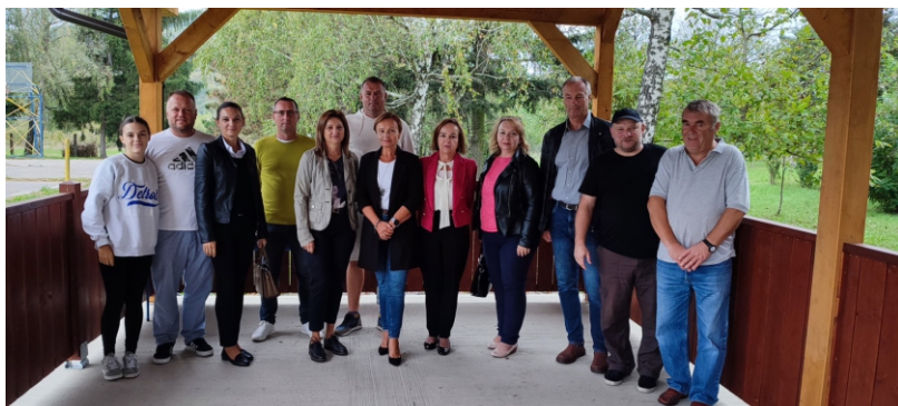
Vedenie školy poďakovalo všetkým, ktorí sa zaslúžili o výstavbu altánku.

Štvrtkové popoludnie 28. novembra 2024 patrilo v našej škole starým rodičom a ich vnúčatám. Napriek daždivému počasiu sa podarilo šikovným deťom zo školského parlamentu a ich pomocníkom vyčarovať úsmev na tvárach starých rodičov, ktorí prišli stráviť príjemné chvíle so svojimi vnúčatami pri šálke ovocného čaju. Deti pre svojich starkých upiekli medovníkové srdiečka, recitovali milé básničky ako prejav úprimnej vďaky za ich obetavosť, starostlivosť, láskavosť. Taktiež deti svojim starkým rozdali reflexné taštičky, pretože myslia aj na ich bezpečnosť. V triedach sa pri spoločných aktivitách a hrách ozýval veselý smiech a dobrá nálada. Veríme, že všetci si zo vzácného popoludnia odniesli pekné zážitky, starí rodičia aj spomienky na svoje školské časy, potešenie zo stretnutí s priateľmi, veľkú radosť zo svojich vnúčatiek. December sa niesol vo vianočnej nálade a atmosfére. Aj tento rok sa deti zo školského parlamentu a ich šikovní pomocníci dňa 6. 12. 2024 zúčastnili predaja na Vianočných trhoch 2024 v obci Zemianske Kostolány. Deti