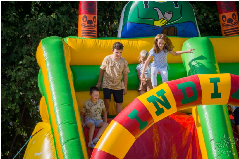
Deti sa zabávali na nafukovacích atrakciách.