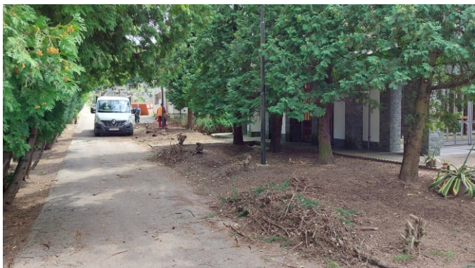
Priestor po odstránení starých drevín a ich koreňových systémov.