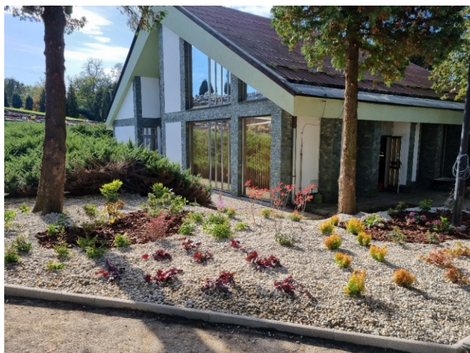
Severovýchodná strana po výsadbe nových trvaliek a úprave záhonov.