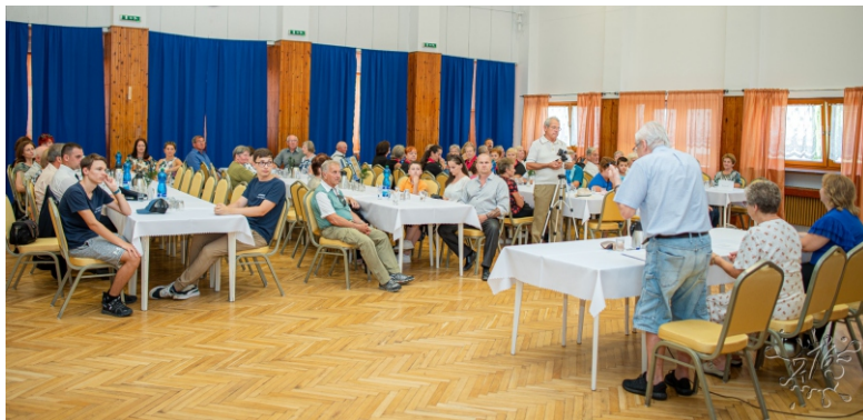
Slávnostná členská schôdza ZO SZPB pri príležitosti 80. výročia SNP.