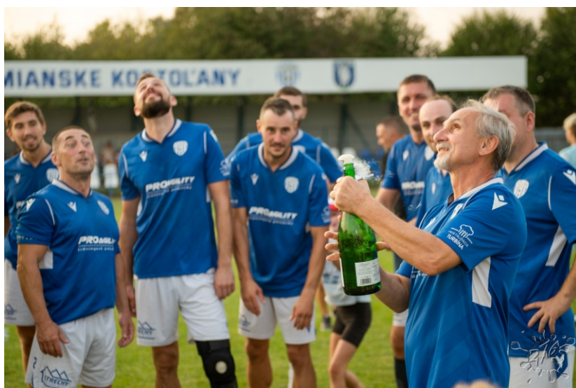
Vít'azné družstvo uličného turnaja Dedina po vyhlásení výsledkov.

A ako dopadol futbalový turnaj? Prvé miesto a putovný pohár získalo družstvo Dedina. Druhá bola Kolónia, bronz si odniesla Domovina a družstvo Kórea/Pod horou obsadilo štvrtý stupienok.