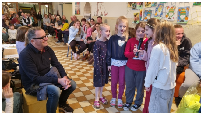
Popoludnie pre starých rodičov.

Naša škola je zapojená do programu Zelená škola, ktorý tento rok oslavoval 20. narodeniny. Zároveň to bola oslava úspechov materských, základných i stredných škôl, ktoré sú do tohto programu zapojené a naša škola nie je výnimkou. Mali sme tú česť prijať pozvanie a prevziať si osobne certifikát za prácu v téme "odpad" a darčeky pre našich žiakov. Certifikát je zrkadlom usilovnosti, spolupráce a láskavosti zamestnancov našej školy, žiakov, rodičov a priateľov školy. Verím, že budeme naďalej meniť veci k lepšiemu. Oslava sa konala v Starej tržnici v Bratislave a zúčastnili sme sa aj workshopu v Tieni kakaovníka. Žiaci sa zapojili aj do súťaže v zbere nefunkčných mobilov, ktoré budú zrecykované a vzácne kovy z nich použité na výrobu nových. Spolu sme vyzbierali 192 mobilov. Zároveň sme súťaž využili na vytvorenie minimúzea na chodbe školy a nahliadli sme do histórie vzniku 1. telefónu.