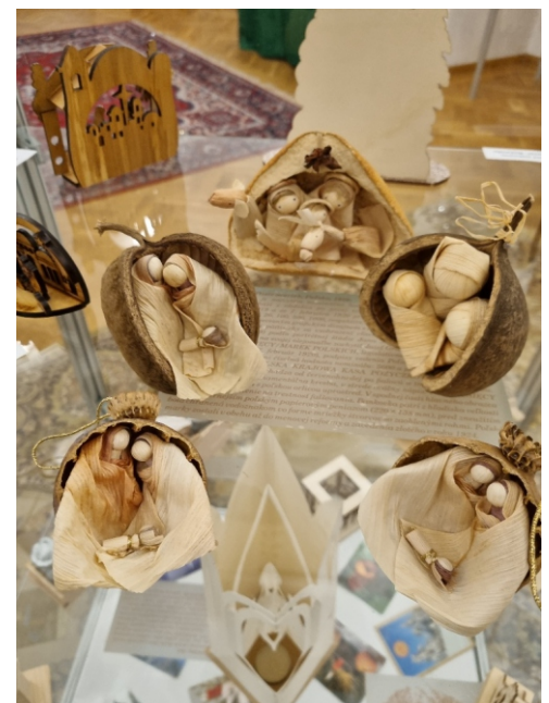
Betlehemy v makoviciach (zo zbierky J. Krasulu).