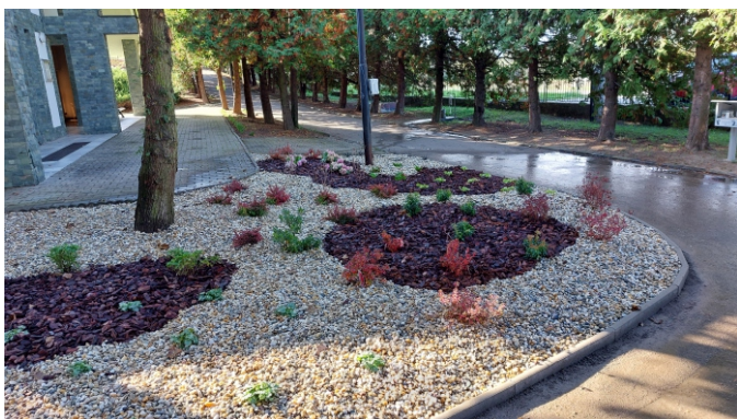
Severozápadná strana po výsadbe nových trvaliek a úprave záhonov.