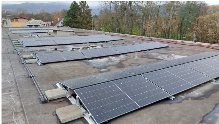
Panely fotovoltaickej elektrárne na budove zdravotného strediska.

Zámer vybudovať pre obecné budovy fotovoltaické elektrárne vznikol na poradách obecného zastupiteľstva a starostky obce ešte v roku 2023 pri tvorbe rozpočtu na rok 2024. Vyhodnotením nákladov na spotrebu elektrickej energie v roku 2023 pre všetky budovy vo vlastníctve obce (je ich spolu 40) sa rozhodlo zastupiteľstvo postaviť obnoviteľné zdroje energie na dvoch budovách, ktoré sa vzhľadom na stavebno-technické parametre a spotrebu energií javili ako najvhodnejšie. Prvou bola budova zdravotného strediska a druhou budova domu kultúry. V rozpočte obce na rok 2024 bola na tento účel vyčlenená čiastka 50 000 €. Prvým krokom, ku ktorému muselo zastupiteľstvo pristúpiť, bolo rozhodnúť o tom, o aký typ elektrárne má obec záujem, pričom vyberali zo štyroch možných alternatív. Vybratá