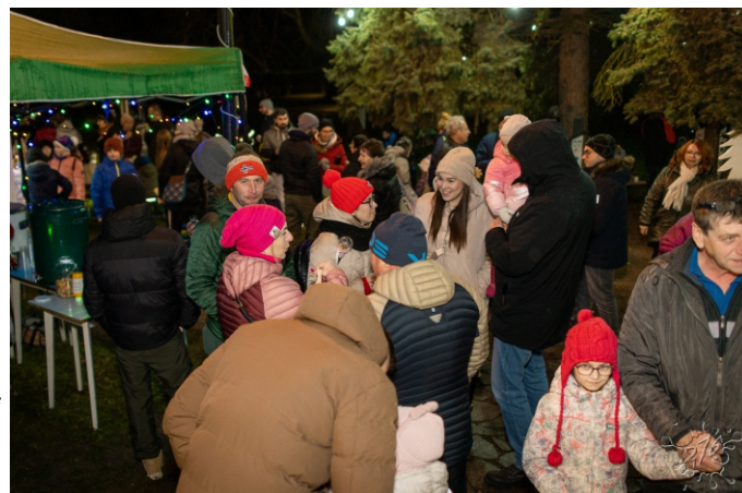
Návštevníci malého vianočného trhu v družných rozhovoroch pri občerstvení (foto vpravo).

Počas návštev Mikuláša už v kaštieli a v parku prebiehali rozsiahle prípravy na malý vianočný trh, ktorý každoročne organizujeme. V poobedňajších hodinách rozložili