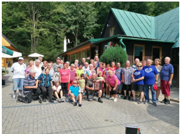
Pobyt v prírode na Píloch. Seniori pri Chata pod Končitou.

Činnosť organizácie je finančne podporovaná dotáciou obce Zemianske Kostolány.