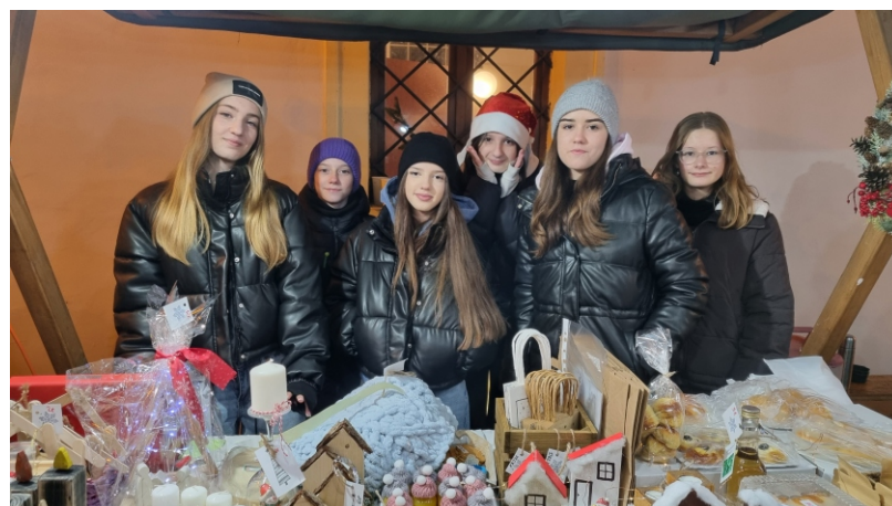
Stánok základnej školy na Vianočných trhoch a predávajúce žiačky.