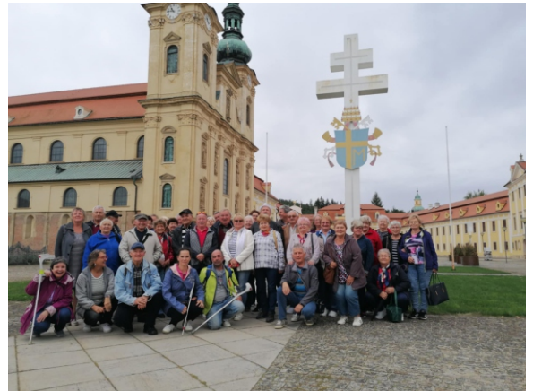
Na výlete vo Velehrade s návštevou baziliky.