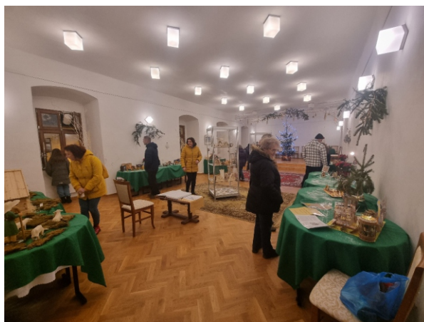
V galérii kaštiela bola prístupná výstava betlehemov z celého sveta (foto vľavo).

Podrobne popísať všetky aktivity, ktoré sa v našej obci uskutočnili počas adventného obdobia, by bolo asi náročné. Veď v tomto roku ich bolo naozaj bohaté. Do ich organizovania sa zapojili rôzne združenia a spoločenstvá. Prvou lastovičkou, naznačujúcou, že prichádzajú Vianoce, bola pochôdzka Mikuláša s čertom v sprievode hasičov po celej obci. Táto milá družina navštívila v uliciach všetky deti, ktorým odovzdala balíčky so sladkosťami. Na druhý deň zavítali do materskej školy a do základnej školy. Po ceste nezabudli obdarovať všetkých, ktorých stretli. Tiež pozdravili seniorov v domove dôchodcov. Pre veľkú chorobnosť a zákaz návštev sa však s nimi nemohli stretnúť osobne, preto sladké pozornosti pre každého odovzdali personálu. Z vďaky ich starke a staríky pozdravili aspoň spoza okien zariadenia.