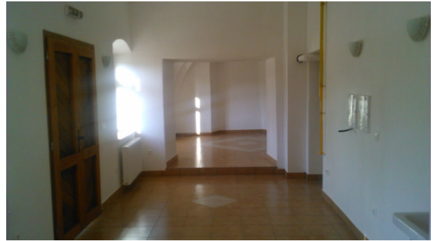
Zrekonštruované nebytové priestory v barokovej kúrii vedľa renesančného kaštieľa. Priestory sú určené na prenájom na komerčné účely.