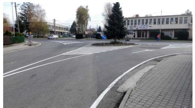
Riešenie križovatky ciest I. triedy (Ulica 4.apríla) a III. triedy (Partizánska ulica) umiestnením zvislého a vodorovného značenia. Súčasťou projektu bolo i vybudovanie nového prechodu pre chodcov a jeho osvetlenie.