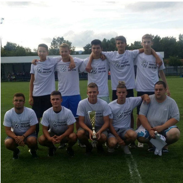
Dorastenci s trofejou za postup do V. ligy.