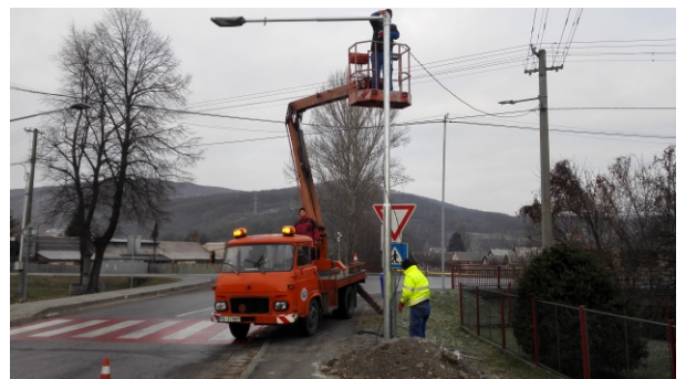
Okrem osvetlenia nového prechodu pre chodcov na Partizánskej ulici boli osvetlené aj ďalšie existujúce prechody - pri bytovkách Domovina a pri autobusovej zastávke v hornej časti Domovina.