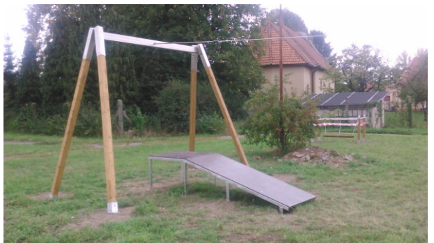
Jeden z prvkov - lanovka - novovybudovaného detského ihriska v areáli miestnej základnej školy. Prínosom bude hlavne pre deti na prvom stupni, ktoré navštevujú školský klub detí.