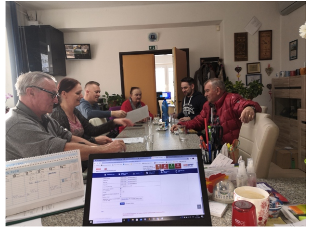
Na čele krízového štábu obce je starostka obce, členmi štábu sú poslanci obecného zastupiteľstva.