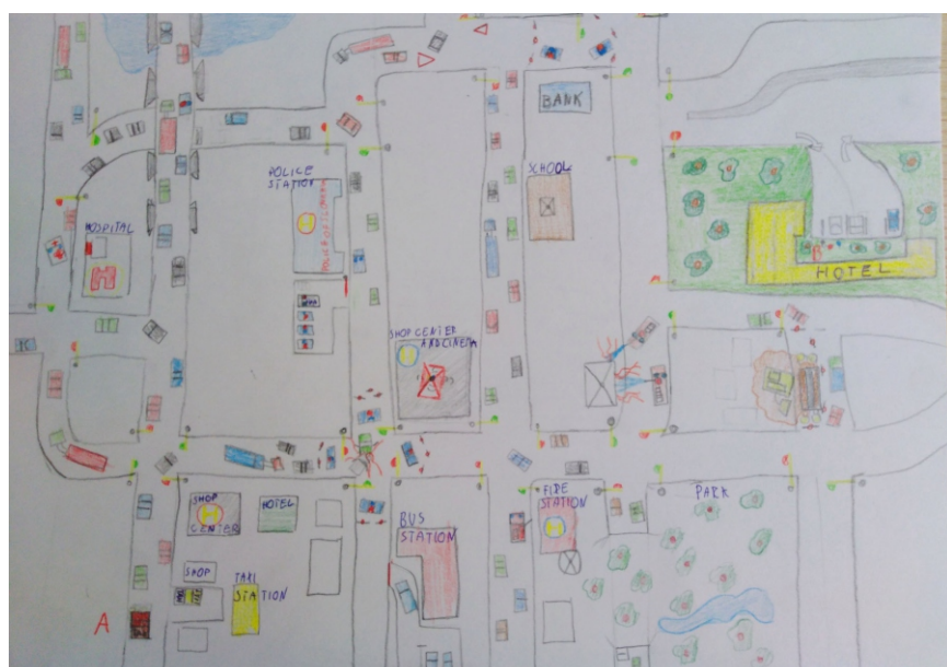
Projekt: anglický jazyk Autor: Ľubomír Tonka