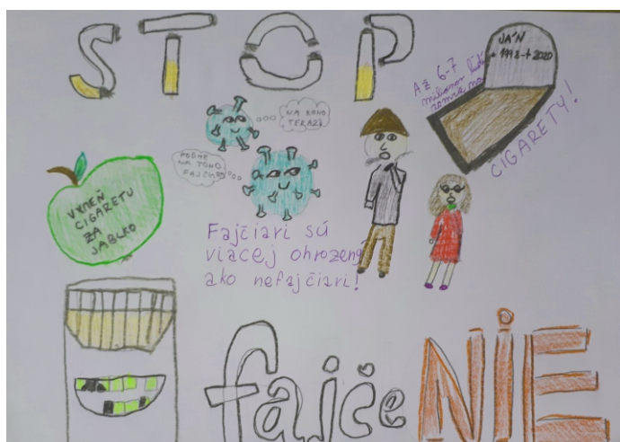
Ilustrátorka práce: Tamara Schvandtnerová

Všetky detské práce vystihli tému, boli zaujímavé, veselé a nápadité. Najlepší tvorcovia a výherkyne súťaže získali ako odmenu pekné vecné ceny, ktoré deti motivovali a zároveň potešili, aby mali chuť zapojiť sa aj do ďalších aktivít a súťaží. Ďakujeme pani vychovateľkám a pani učiteľkám, ktoré aj takýmto spôsobom podporujú deti v snahe stať sa lepšími a rozvíjajú detskú fantáziu a kreativitu.