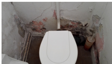
Tieto snímky zobrazujú pôvodný stav priestoru pred začiatkom obnovy.

Lavičky však neboli tým jediným, čo areál postrádal. Návštevníci mali doposiaľ určité problémy s bezpečným odložením osobných vecí, s prístupom k pitnej vode i s absenciou funkčných sociálnych zariadení. Na tento účel bol preto obcou vyčlenený samostatný priestor v Dome kultúry SNP, ktorý v čase vykurovania pevným palivom slúžil ako byt pre kuriča a neskôr pre správcu. Situovaním vchodu k areálu tenisových kurtov je priestor akoby predurčený na šatne a hygienické priestory pre ich návštevníkov.