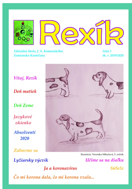
Nový školský časopis REXÍK