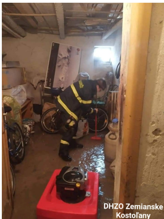
DHZO Zemianske Kostoľany